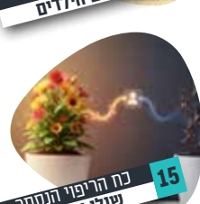
15 כח הריפוי הנסתר שולי שמואלי