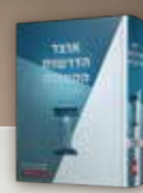
אוצר הדרשות הקצרות (2 כרכים)