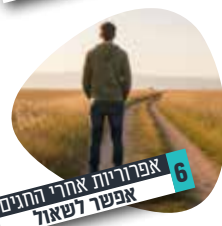
6 אפרויות אחרי החטא אפשר לשאול