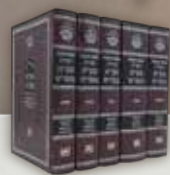
מקרא מפורש 5 חומשי תורה - עוז והדר (5 כרכים)