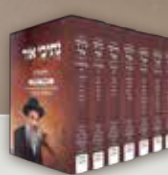
נתיבי אור על התורה הרב נסים יגן (7 כרכים)