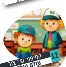
12 הסיפור של צור עולם הילדים