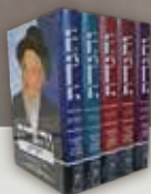
והגדת על התורה הרב יעקב גלינסקי (5 כרכים)