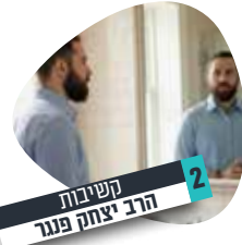
2 קשיבות הרב יצחק פנח

אדם שאינו מודע להבדלים הטבעיים בנפש כל אחד מבני הזוג, כאשר ילמד את דרישות הרמב"ם