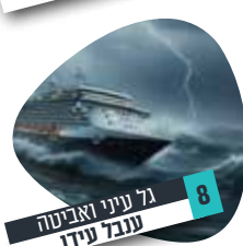
8 גל עיני ואברטה עובד עידן