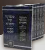
פשוטו של מקרא ורשי" כפשוטו (5 כרכים)